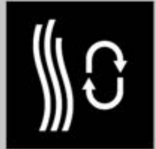
Thermal healing of superficial microscratches