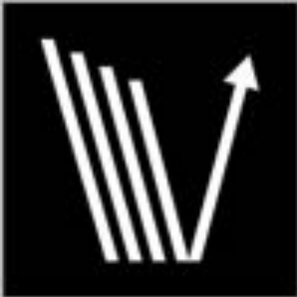
Low light reflectivity

Suitable for contact with food. Materiale idoneo al contatto alimentare.